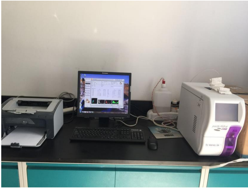
7. 全自动湿式生化仪